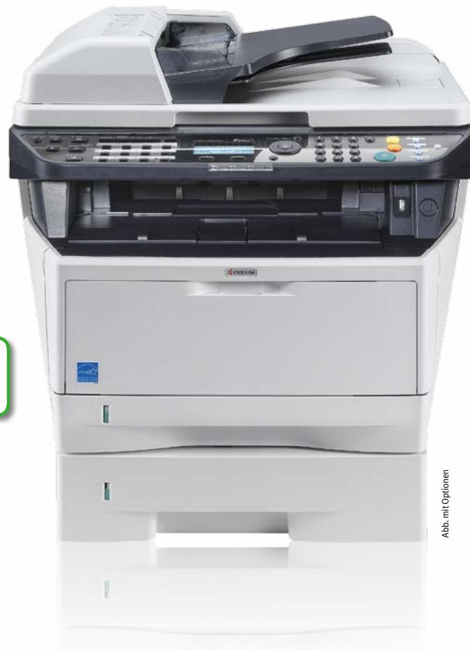
Abb. mit Optionen